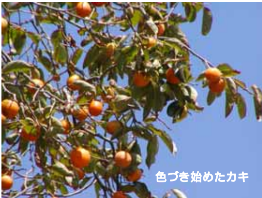
色づき始めたカキ

9月に入ってからも暑い日が続きましたが、ようやく秋らしくなってきました。しかし、今年は大型台風が2度も近畿地方を襲ったため、あいな里山でも紅葉ではなく、風や塩害により枯葉が目立っています。先月の里山管理講習はスズメバチやマムシの勉強をしましたが、これからの季節は、一番危険な時期です。里山に入る際には、くれぐれも注意しましょう。