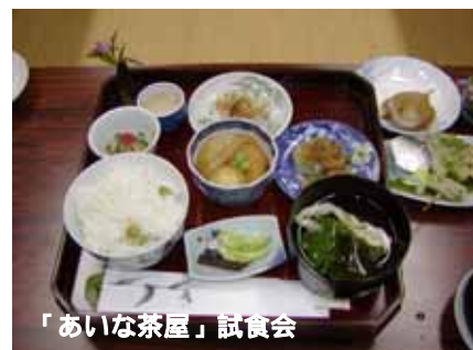
「あいな茶屋」試食会

藍那における食など生活の伝統を伝え残していこうとして、江戸時代の食器や新鮮な里山の食材をつかった料理を現在試行しています。藍那のお母さんたちのグループです。