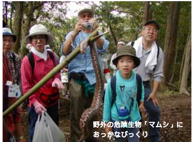
野外の危険生物「マムシ」におっかなびっくり

9月の講習は、「野外の危険生物と秋草を学ぶ」と題して、草本、樹木の調査、スズメバチやマムシの対処方法から救急対応の勉強をしました。10月はチェーンソーの講習ですが、30、31日の両日とも講習生みのみのプログラムとなっており、聴講はできませんので御了承ください。