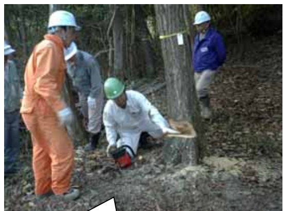
幹周 80cm もの大木の伐採も講習で学びました。