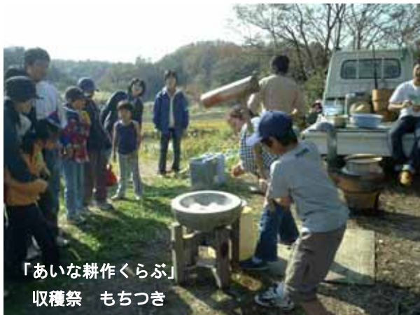
「あいな耕作くらぶ」 収穫祭 もちつき

また、UPP フェスタ 2004 も開催されて、子どもたちも多く収穫祭に参加しました。