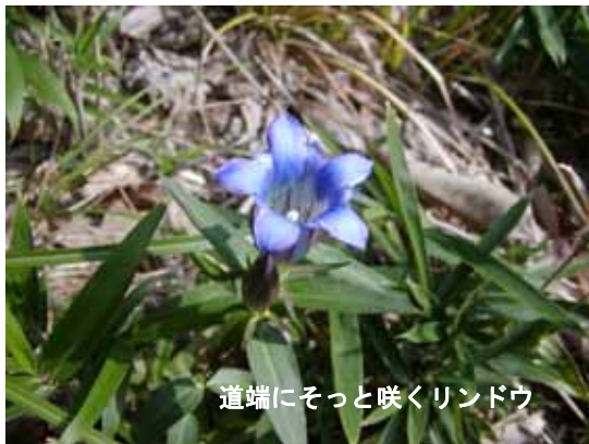
道端にそっと咲くリンドウ

11月26日には、来年2月に開催予定の「第6回あいな里山まつり」の第一回実行委員会が開かれ、12月にも実行委員会を2回開催予定です。ますます、「あいな里山」がにぎやかになります。皆さんいっしょに盛り上げていきましょう！