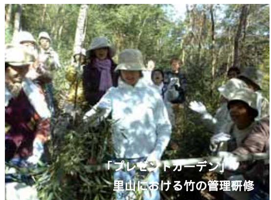
「プレゼントガーデン」 里山における竹の管理研修

「あいな里山」では、すでに市民の皆さんが自主的な活動や事業の準備を始めています。現在行われている活動・事業の内容をお知らせします。興味のある方はぜひあいな里山に足をお運びください。