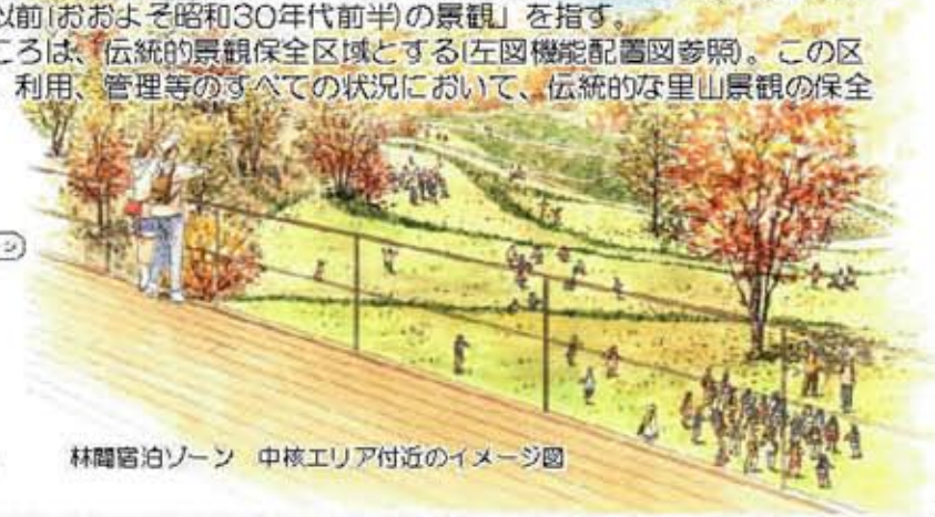
林間宿泊ゾーン 中核エリア付近のイメージ図