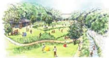
レクリエーションエリアのイメージ図