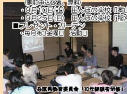
兵庫県教育委員会「10年経験者研修」

※備考 書かれている内容、日時はあくまでも予定ですので、変更の可能性もあります。 また、内容によって、参加費等が必要なものもあります。 詳細を知りたい方は、各団体にお問い合わせください。