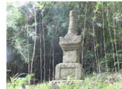
藍那辻の宝篋印塔

藍那駅の近くには、他に七本卒塔婆と言われる石造物があり、創作は南北朝時代と思われるのですが、何の目的で建てられたのか不明です。