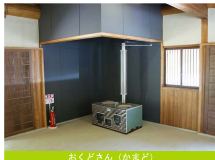
おくどさん（かまど）