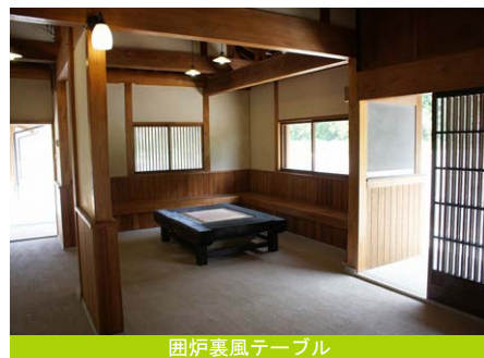
囲炉裏風テーブル