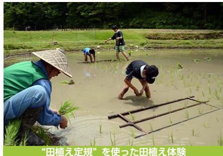
“田植え定規”を使った田植え体験

この田植えまつりをはじめ、やまもまつり(7月)、里山まつり(10月)、とんど焼き(1月)を公園の“四大まつり”として、開園後も育てていきたいと考えています。