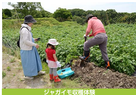
ジャガイモ収穫体験