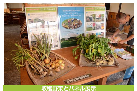
収穫野菜とパネル展示