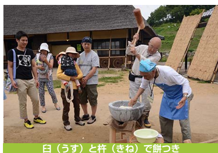
臼(うす)と杵(きね)で餅つき