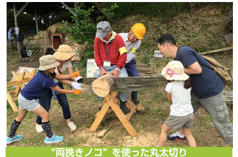
“両挽きノコ”を使った丸太切り