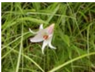
かぐわしい香りとともに、ほんのりピンクの白い花「ササユリ」 あいな里山にふさわしい花です

また、それぞれの情報の詳細については、各事務局までお問い合わせいただきますようお願いいたします。