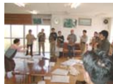
常設サロンのお楽しみ 竹の楽器「アंकフルン演奏」