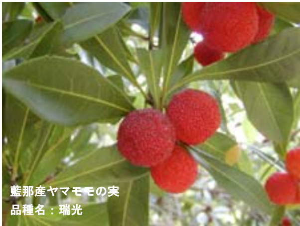
藍那産ヤマモモの実 品種名：瑞光

国営明石海峡公園神戸地区では、あいな里山を活かした公園の整備や運営を目指しています。また、市民による自主的な活動や事業をとおして、皆様といっしょにつくりつづけています。