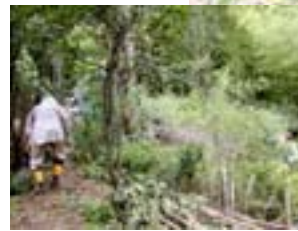
「あいな炭焼くらぶ」 炭焼は主に冬行いますが、夏は、ヤマモモの管理や炭材の樹林管理を行っています。