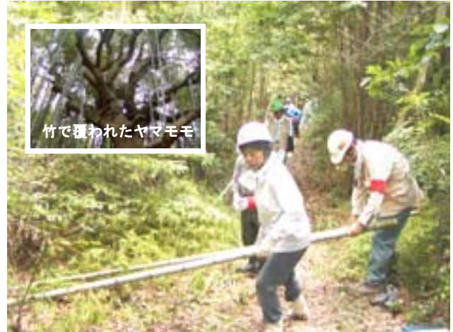
竹で覆われたヤマモモ

8月8日(日)には里山の生き物を観察し、管理方法を学びます。当日は受講生以外に聴講生も募集いたしますので、ぜひお申込ください。