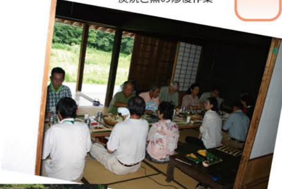
9月10日「わかば会」環境ボランティアによる座談会