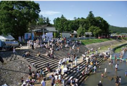
第3回押部谷明石川まつりのようす

開園までは、まだ年月を要しますが、少しずつ認知されていくように広報もしていきたいと思えます。