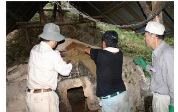
9月10日「あいな炭焼くらぶ」による炭焼き窯の修復作業