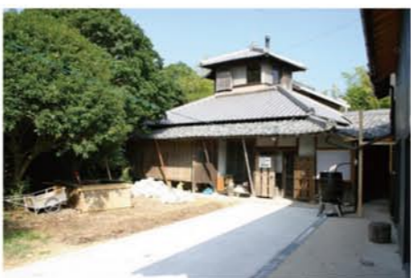
改修を終えた藍那山荘