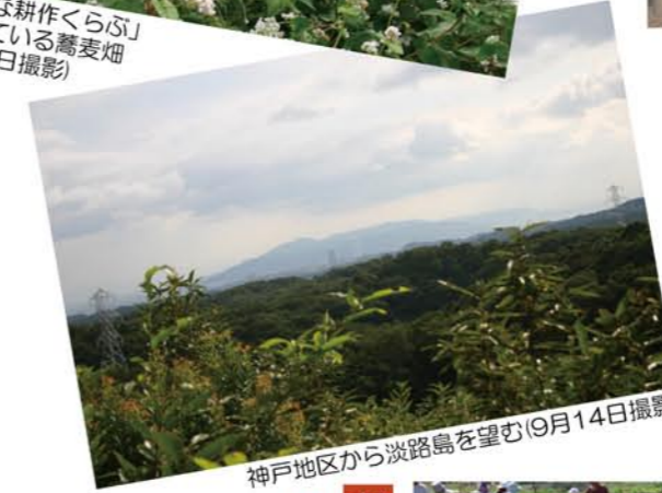
神戸地区から淡路島を望む(9月14日撮影)