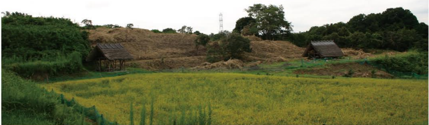
棚田ゾーン造成予定地