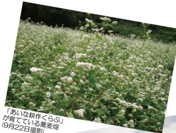
「あいな耕作くらぶ」が育てている蕎麦畑 (9月22日撮影)