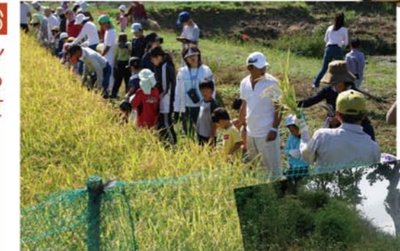
9月23日「神戸市北区おやこコムづくり道場」による稲刈りのようす