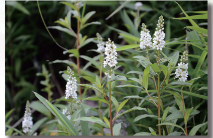
ヌマトラノオ (沼虎尾)