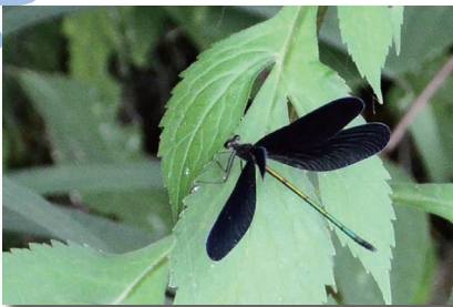
ハグロトンボ (羽黒蜻蛉)