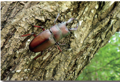
ノコギリクワガタ (鋸鋏形)