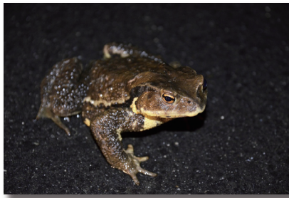
ニホンヒキガエル (日本蟾)