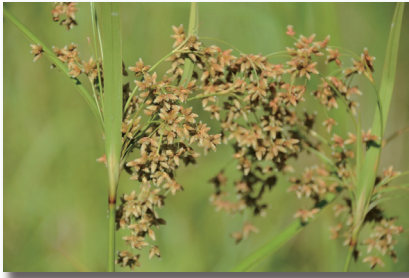
エゾアブラガヤ (蝦夷油萱)