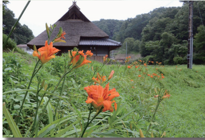
ヤブカンゾウ (藪萱草)