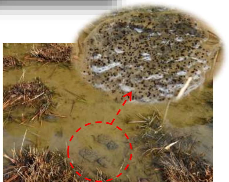
ニホンアカガエルの卵 (2/14時点で77個を確認)