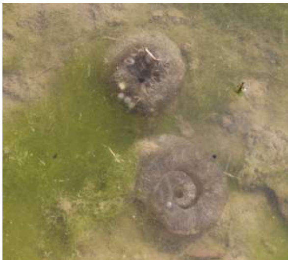
カスミサンショウウオの卵 (2/14時点で4個を確認)