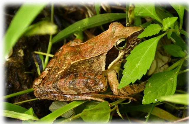
ニホンアカガエル